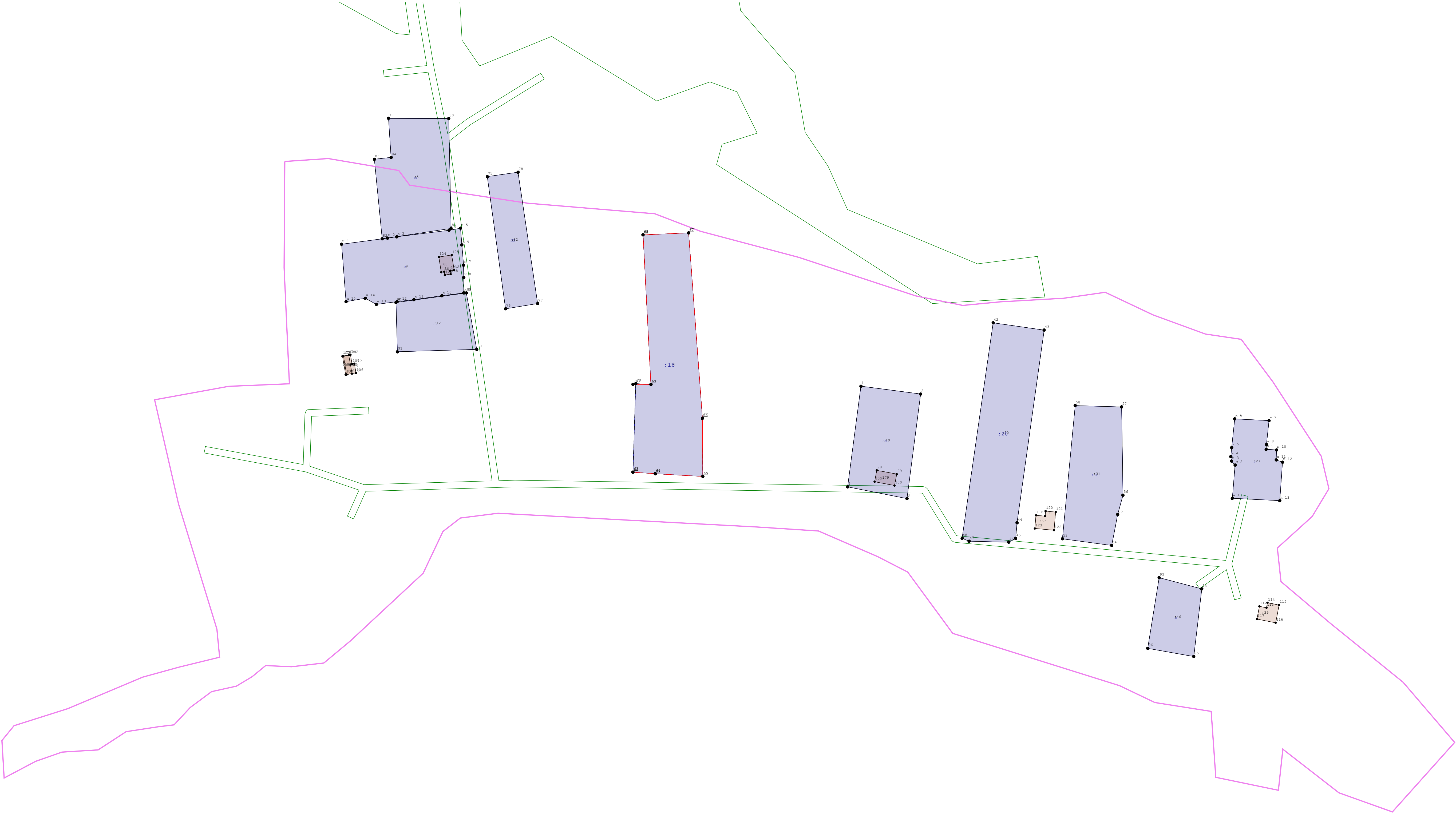
Масштаб 1:1 200